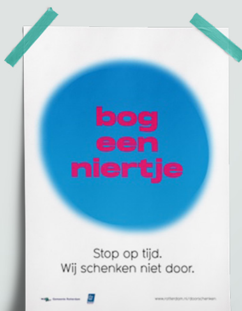
Beeldmateriaal uit de publiciteitscampagne die in Rotterdam Centrum is ingezet.